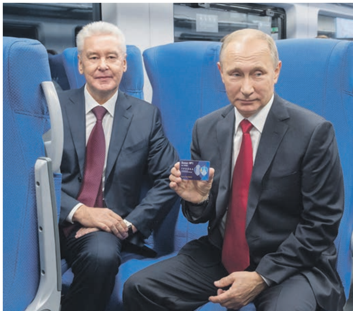
10 сентября 11:48 Мэр Москвы Сергей Собянин (слева) и президент России Владимир Путин в вагоне поезда «Ласточка», который курсирует по Московскому центральному кольцу. В руке у президента — транспортная карта «Тройка» нового образца с символикой МЦК

В рекордно короткие сроки — за четыре года — городские и федеральные власти совместно с Российскими железными дорогами превратили заброшенную окружную в новую ветку наземного метро. По вашему поручению Московское центральное кольцо должно было превратиться в пассажирское. 54 километра готовы к запуску, — обратился Сергей Собянин к Владимиру Путину. Открытие движения состоялось на станции «Лужники», которая похожа на уменьшенную копию стадиона. Турникеты — как в метро. Владимир Путин и Сергей Собянин вместе с делегацией сядут в вагон поезда с панорамными окнами. Они проедут одну остановку — до станции «Площадь Гагарина». Время в пути занимает три минуты. При поездке на метро путь с двумя пересадками составит от 22 до 30 минут. Выгода очевидна. Сегодня мы открываем 26 станций, в ближайший месяц откроем еще пять станций, — отметил Сергей Собянин. — Кольцо позволит перевозить от 150 до 300 миллионов пассажиров ежегодно, по мере накопления активности движения. Кстати, билеты метрополитена будут действительны на Московском центральном кольце (МЦК). Федеральные и региональные льготы также сохранятся. Пассажирам гарантирована бесплатная пересадка в течение 90 минут в структуре метро. К тому же правительство Москвы приняло решение