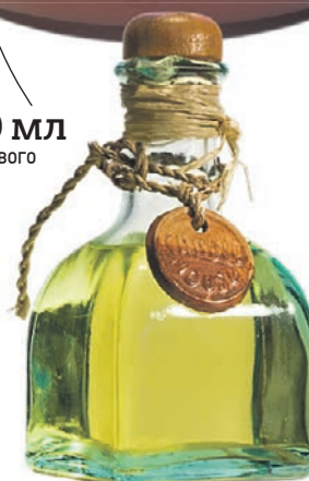
250 мл оливкового масла