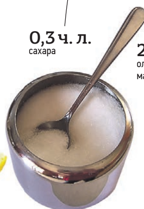
0,3 ч. л. сахара