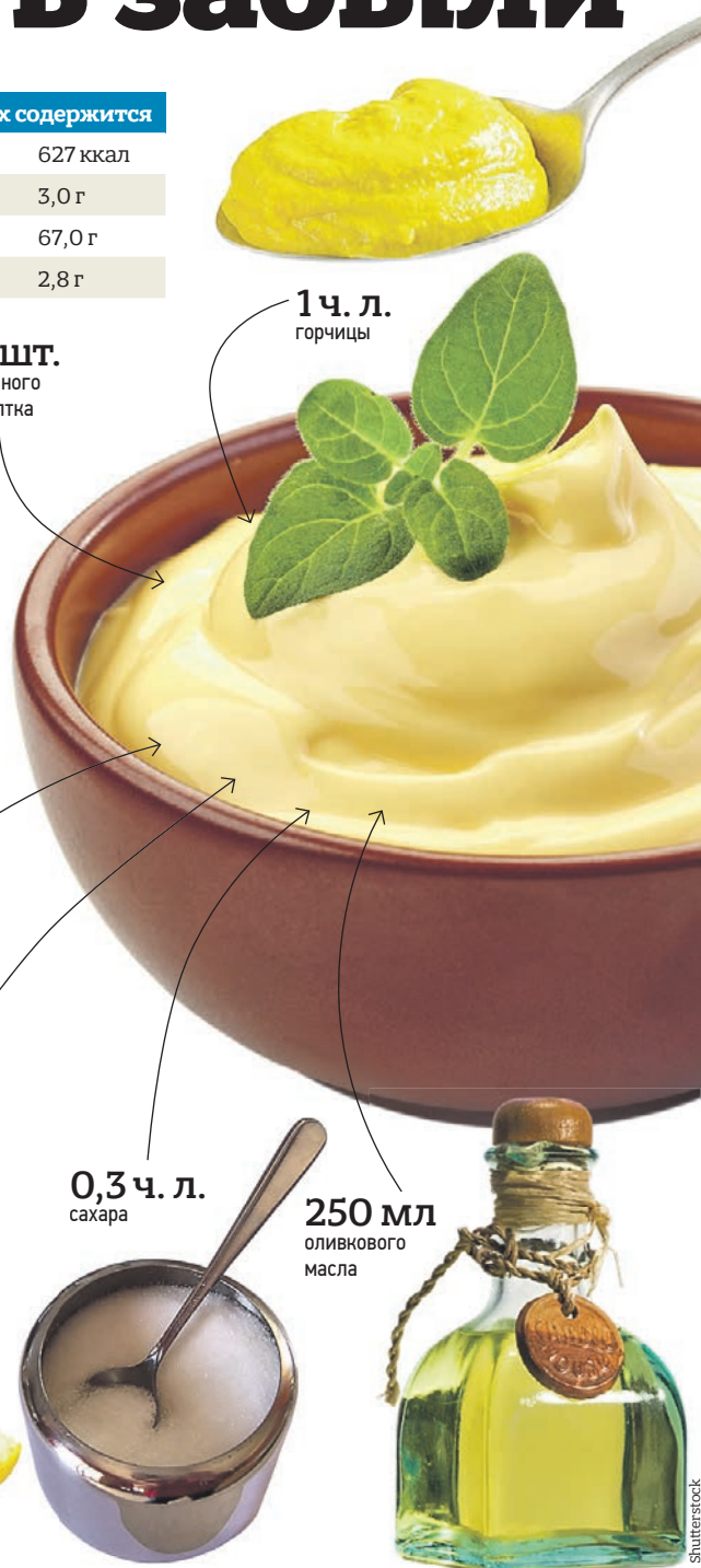
1 ч. л. горчицы