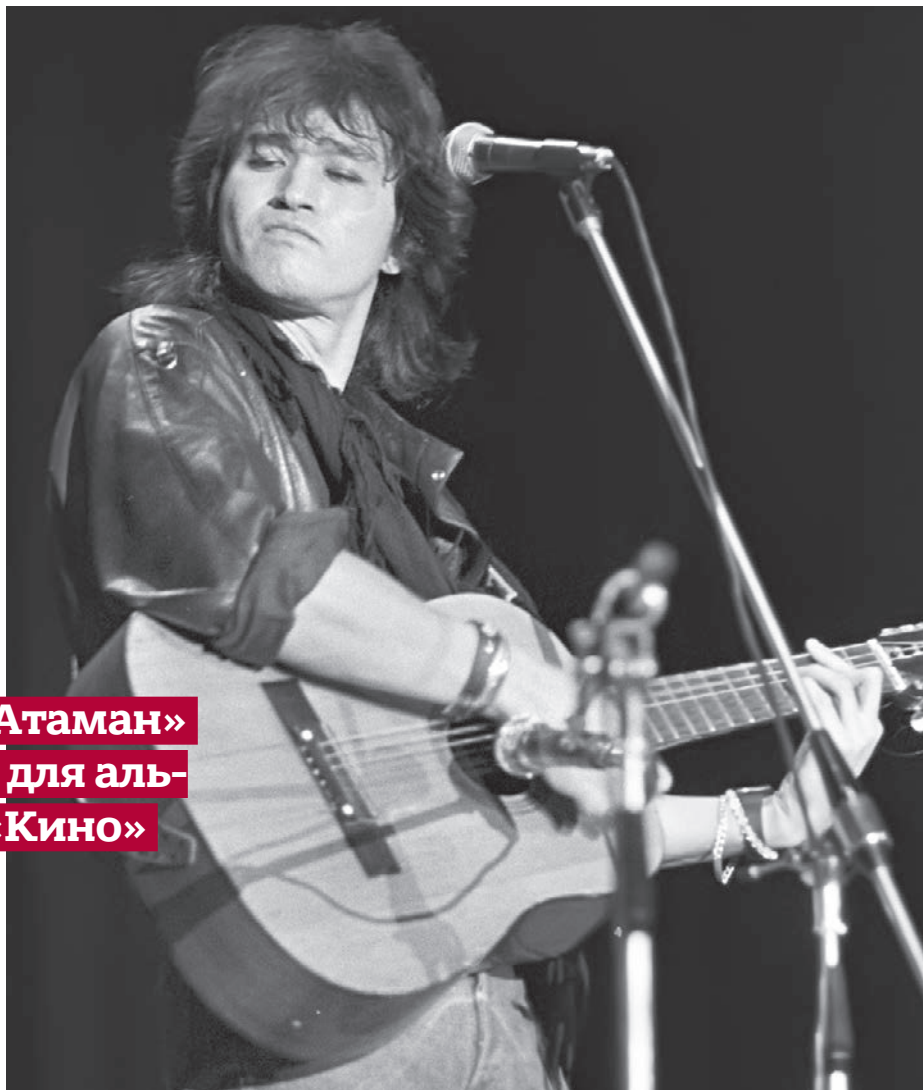
3 ноября 1988 года. Виктор Цой во время выступления в спортивно-концертном комплексе «Октябрьский»