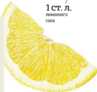
1 ст. л. лимонного сока