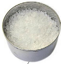
0,3 ч. л. соли