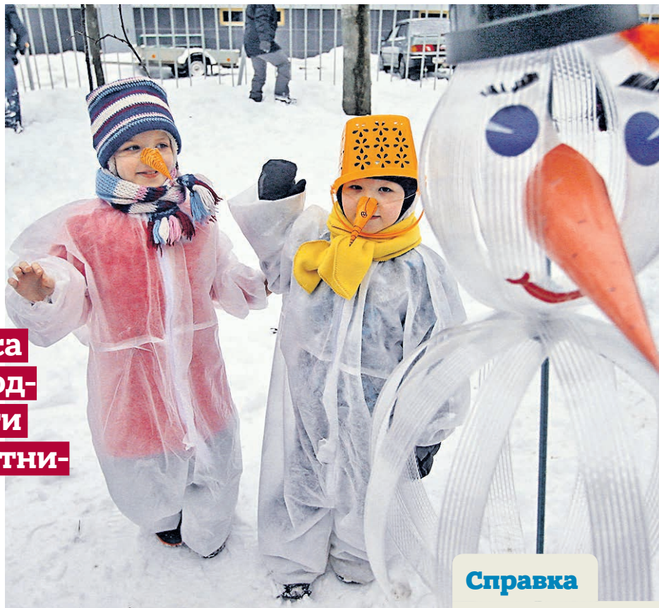
18 декабря 2017 года. Участники фестиваля снеговиков в городе Троицке

Зимний сезон в столичных парках начнется уже