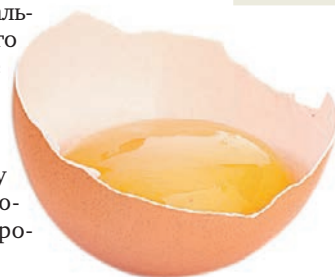
3 шт. яичного желтка