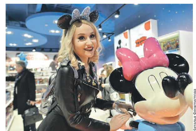
Одной из «остановок» на экскурсионном маршруте стал Центральный детский магазин

Далее маршрут пролегает через Красную площадь, ГУМ, Никольскую улицу, Центральный детский магазин на Лубянке и Новую площадь. Завершается прогулка в «Зарядье».