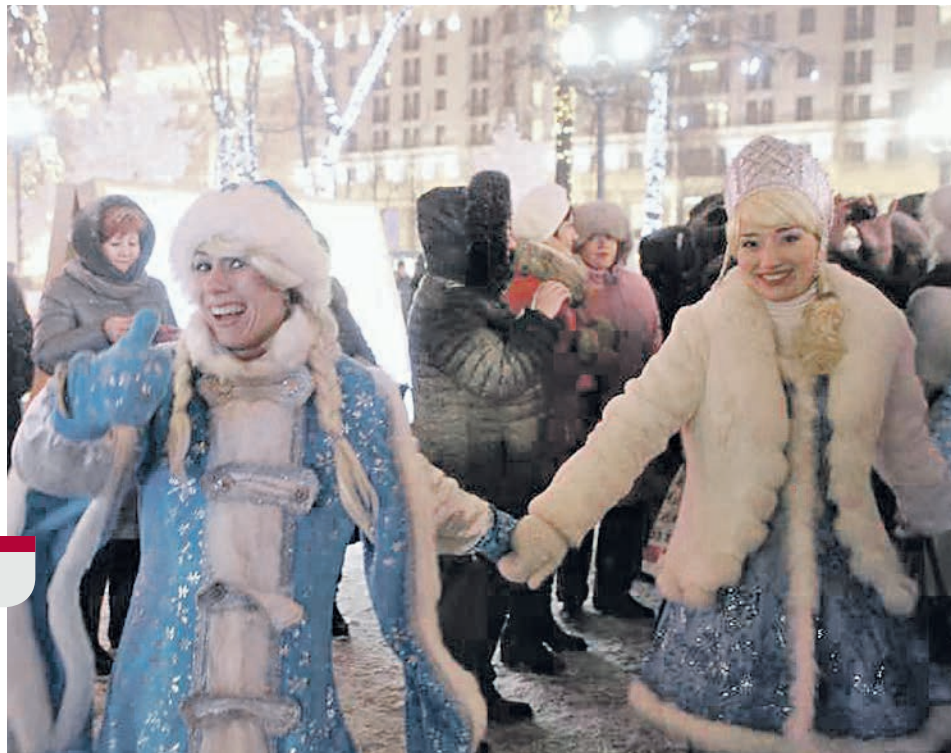
12 января 2017 года. Парад снегурочек собрал большое количество зрителей. Программа новогодних гуляний в столице в этом году будет не менее интересной

Детей развлечет оркестр «Снеговиков» и уличный театр «Черный квадрат», ко-