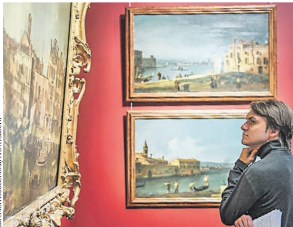
23 июля 2018 года. Экспозиции Пушкинского музея всегда привлекают посетителей