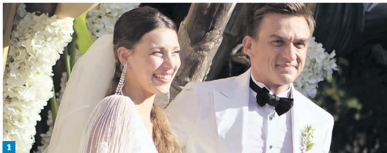
YouTube канал Регины Тодоренко

их нарядов. Возьмите этот прием на вооружение: это очень стильно смотрится на совместных свадебных фотографиях. Ну и, конечно же, выездные регистрации. Сейчас многие молодожены предпочитают регистрировать брак не в душных дворцах бракосочетания, а где-нибудь на природе, что тоже в условиях пандемии очень даже кстати. Как известно, в первое воскресенье после Пасхи народ отмечает православный праздник — Красную горку. Считается, что пары, поженившиеся именно в этот день, получают крепкий и счастливый брак на всю жизнь. К тому же теплая весна — время любви и отличная пора для этого важного праздника. Однако в то же время давно считается, что в мае играть свадьбу — плохая примета и молодожены будут маяться друг с другом и в итоге разведутся. Лично я всегда очень верила в приметы. Но на свой страх и риск впервые вышла замуж в мае, и брак распался. Последующие свадьбы были летом и зимой, и тоже союзы оказались неудачными. Кому же верить? Своему сердцу! Я бы не стала брать во внимание все эти многочисленные приметы и обряды. Если вас зовут замуж, не стоит отказываться и перекладывать свадьбу на другие месяцы. Вдруг потом такого шанса не будет. Надо, как говорится, брать быка за рога. А потом разберетесь.