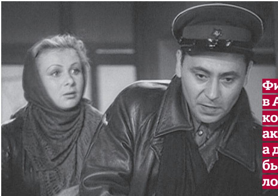
Валентина Серова в роли Лизы (слева) и Лев Свердлин в роли военного фотографа Михаила Вайнштейна