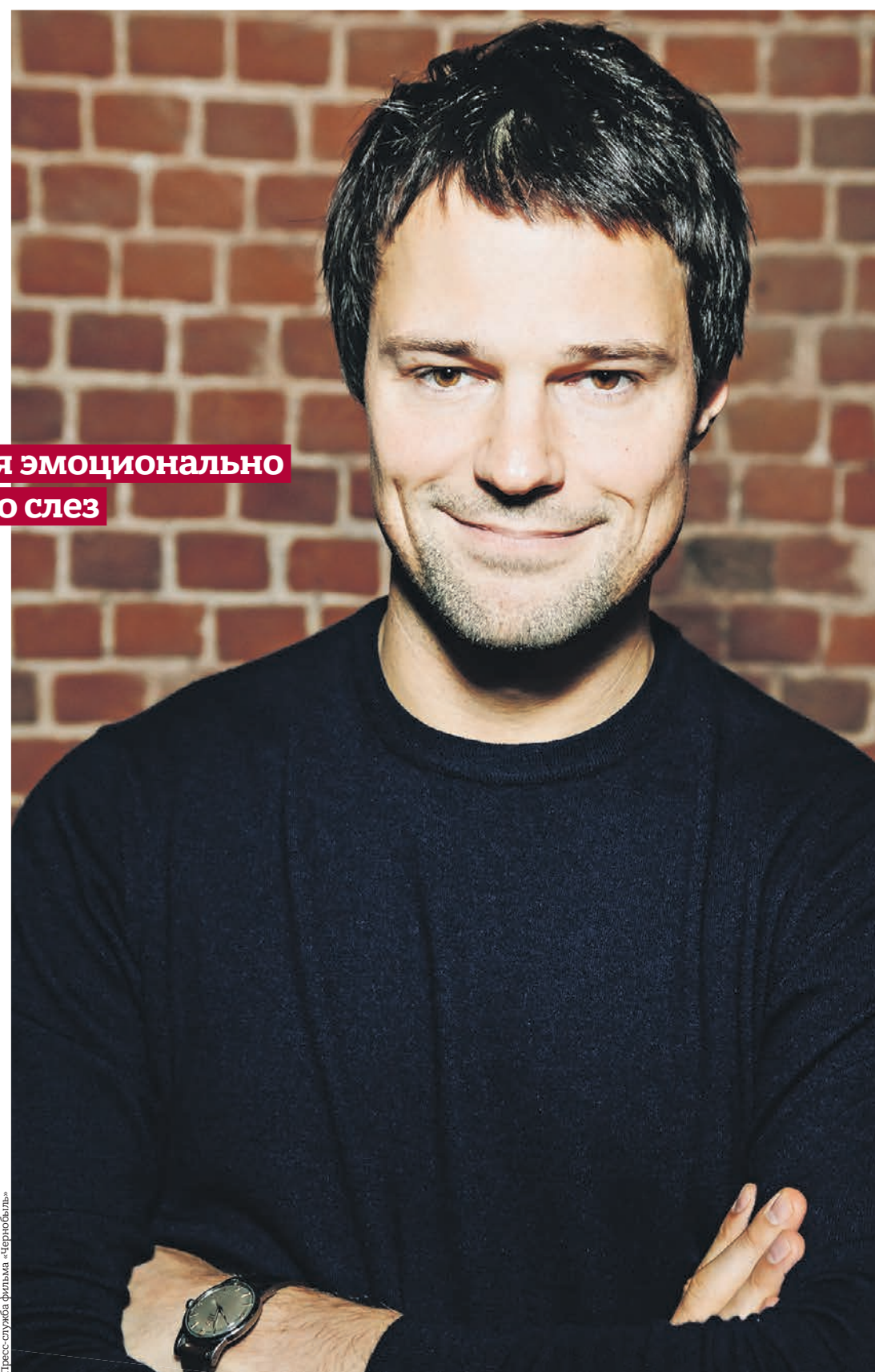
Пресс-служба фильма «Чернобыль»