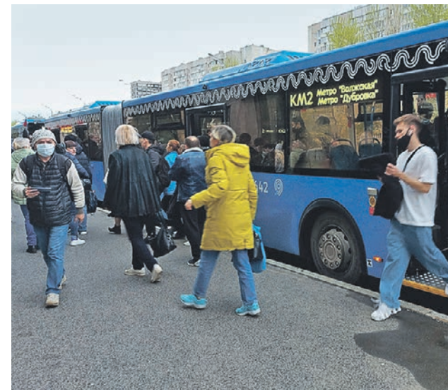
1 мая 2021 года. Автобусы КМ на закрытом с 1 по 23 мая участке между станциями «Дубровка» и «Волжская»