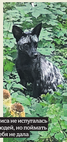
Лиса не испугалась людей, но поймать себя не дала

Вчера корреспондент «Вечерки» встретил в своем дворе необычную для мегаполиса обитательницу — чернобурую лису. Оказалось, хищница за день до этого успела посетить пустующий детский сад и переполошить местных жителей. Но спасателям не удалось отловить проворную лисицу. Откуда взялась редкий зверь с. 13