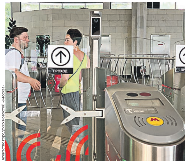
Турникеты на станции «Ботанический сад» оборудованы камерами с системой распознавания лиц