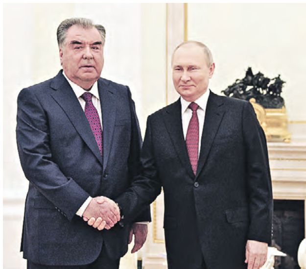
Слева направо: президент Таджикистана Эмомали Рахмон и президент России Владимир Путин

— Надеюсь, что организация, которая за предыдущие годы превратилась в полноценную международную структуру, будет развиваться и дальше, — заявил на саммите Владимир Путин. По словам Владимира Путина, на осень этого года запланирована целая серия совместных учений стран-участниц: в Казахстане, Кыргызстане и Таджикиста-