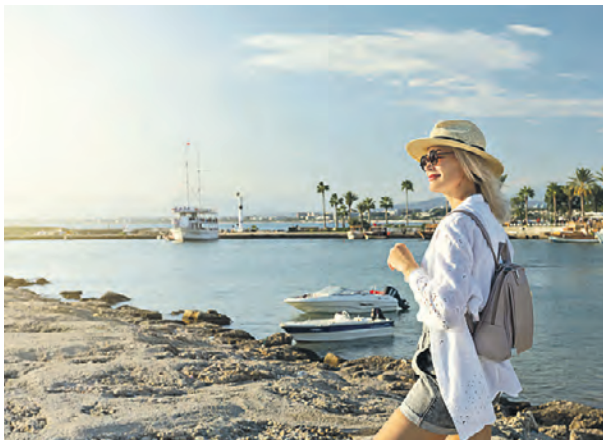
Отдых на турецких берегах Черного моря продолжит пользоваться спросом среди российских туристов