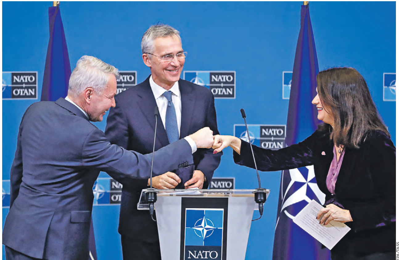
24 января 2022 года. Слева направо: глава МИД Финляндии Пекка Хаависто, генеральный секретарь НАТО Йенс Столтенберг и глава МИД Швеции Анн Линде на пресс-конференции по итогам встречи в Брюсселе

Вступление в НАТО для Швеции и Финляндии может закончиться плачевно