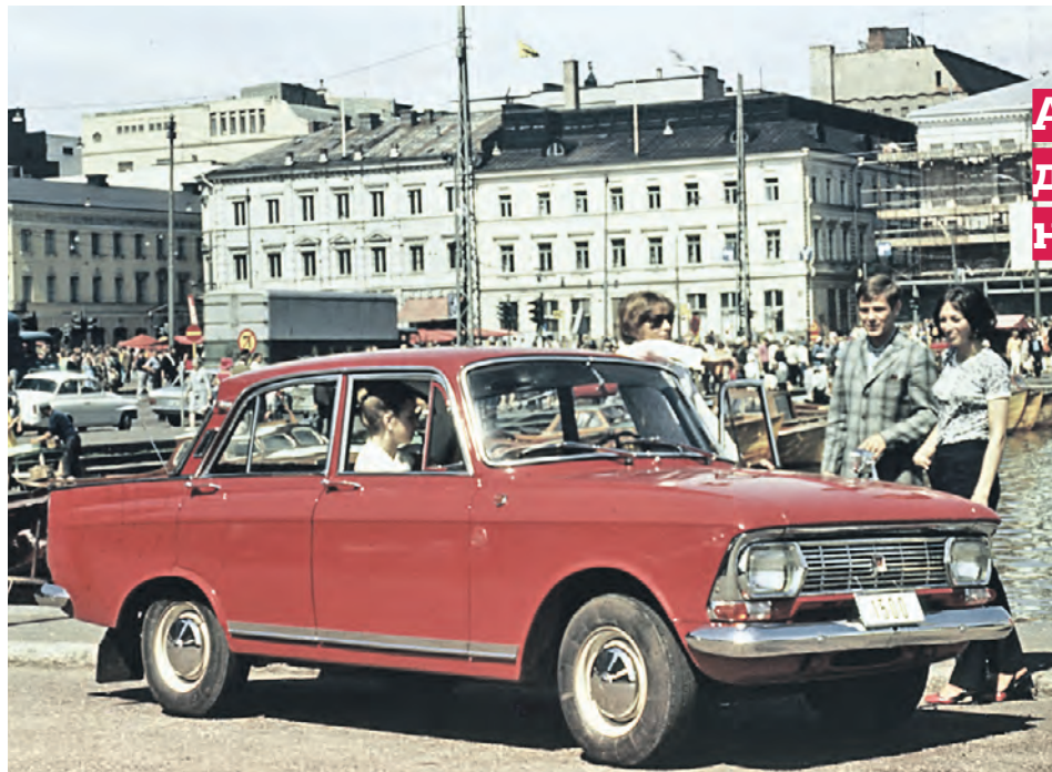
1970 год. Жители столицы остановились на «Москвиче-412» на одной из улиц города

Легендарный завод по производству машин возродят в столице