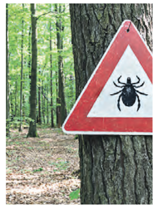
Предупреждающий знак «Опасно, клещи!»